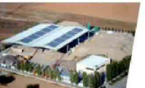
Produciamo materiale per sottofondi utilizzando energia pulita