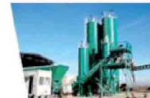
... e calcestruzzo recuperando rifiuti

Via Rana 184 - Zona D5 Spinetta Marengo (AL) Tel. 0131 617507 Fax 0131 611743 www.sapriciclati.it sap@sapriciclati.it